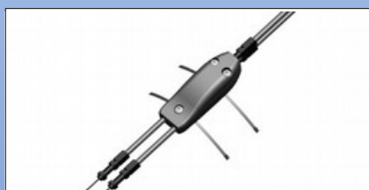
RS1f. Kabelset für Einhandbremse