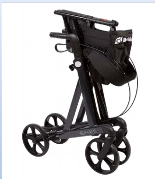
RB1b. Der Rollator gefaltet