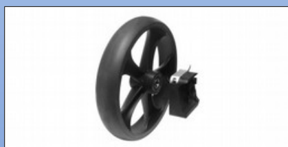
RS1c. Schleifbremse (Set mit 2 Stk.)