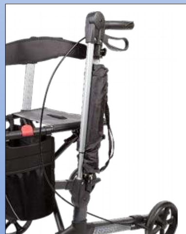
RL2d. Regenschirm montiert