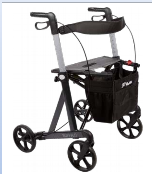
RB1a. Mobilex Rollator Buffalo HD