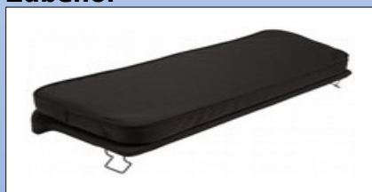
RS1a. Harter gepolsterter Sitz