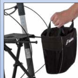
RB1d. Abnehmbare Einkaufstasche